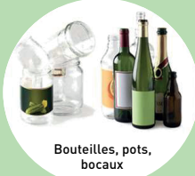
Bouteilles, pots, bocaux

SANS BOUCHONS BIEN VIDER INUTILE DE LAVER